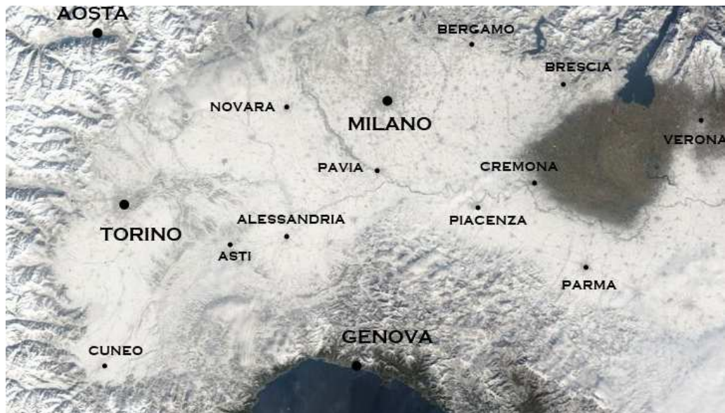
Innevamento della pianura padana visto dal Satellite del 04 Febbraio 2012

sulle zone di pianura mentre sulla fascia collinare e soprattutto appenninica il gelo si farà ancora sentire in maniera marcata.